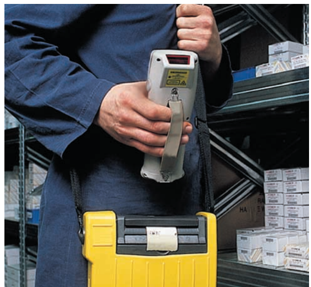
Mobile Lade-/Übertragungsstation F985/V