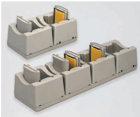
Formula 975/4 und Formula 975/8

Die Formula 975 Mehrfach-Ladestation eignet sich hauptsächlich für Applikationen, die einen intensiveren Terminalgebrauch erfordern und daher extrem reduzierte Ruhezeiten aufweisen.