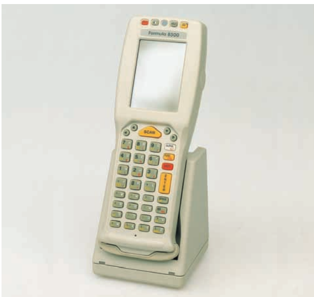
Formula 8500 und Formula 985 Lade-/Empfangsstation

Der Formula 8500 Laser Handheld PC kann also auf verschiedene Art kommunizieren: Die Übertragungsrate beträgt bis zu 115 Kbps bei Kommunikation über Modem mit PCMCIA-zertifizierten Adaptern oder über LAN mit PCMCIA-zertifizierten Ethernet oder Token Ring Adaptern.